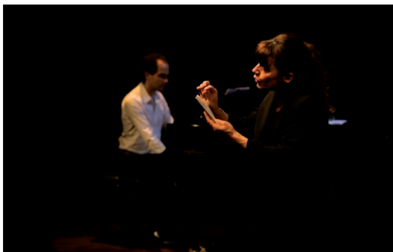
> Mon Pouchkine de Marina Tsvetaïeva • Théâtre du Frêne

Note d'intention pour Couleurs femmes 12 e édition du Printemps des Poètes 2010